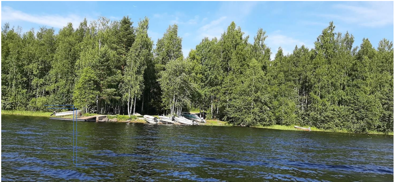
Venevalkama-alue (LV) Hämäläisen tilan keskikohdalla.