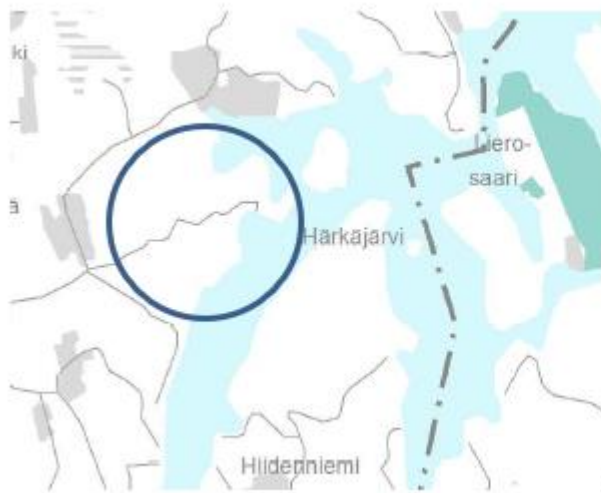
Ote maakuntakaavojen yhdistelmästä.

Yleiskaavaa alueella ei ole, myöskään sitä ei ole vireillä.