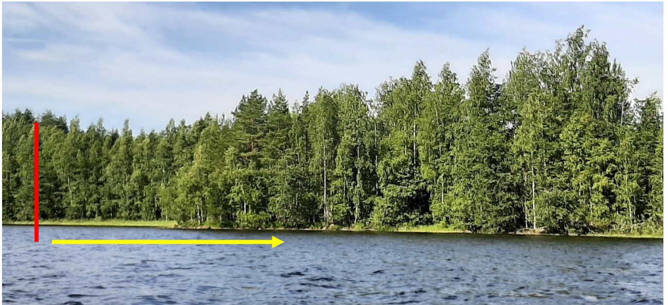
Ranta tilan eteläosaa korttelin nro 3 rakennuspaikan 2 kohdalta; korttelin eteläraja puneella – likimain.