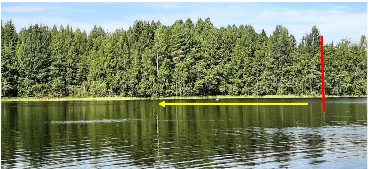
Ranta tilan pohjoisosassa korttelin nro 1 kohdalta; korttelin raja – puneella - likimain.