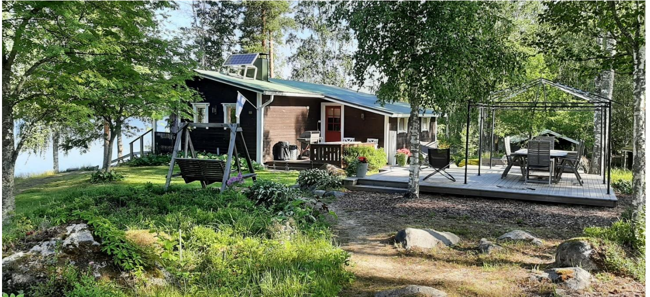
Lehtiniemen tilan lomarakennus korttelissa 2.

Hämäläisen tilaan kuuluu Härkäjärven mannerrantaa ja kaksi saarta, joista Lehtisaaren osa on Lehtiniemen tilaa. Hämäläisen tilalla ei ole rakennuksia. Lehtiniemen tilalla on 75 k-m 2 lomarakennus, rakennettu vuonna 1965 sekä talousrakennuksia; 15 k-m 2 puuliiteri, rakennettu 1965, 9 k-m 2 aitta, rakennettu vuonna 1920 ja siirretty Lehtiniemeen sekä 18 k-m 2 varasto/WC, rakennettu vuonna 2018.